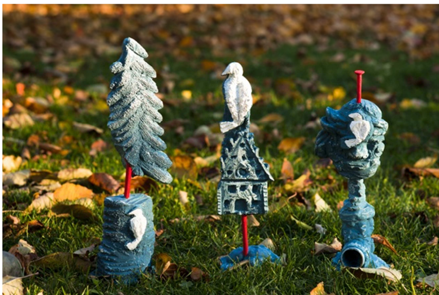
Sošky ocenenia Biela Vrana 2010.

Sošky Bielej Vraný vytvoril, tak ako aj v roku 2009, sochár a výtvarník Fero Guldán ( www.feroguldán.com ).